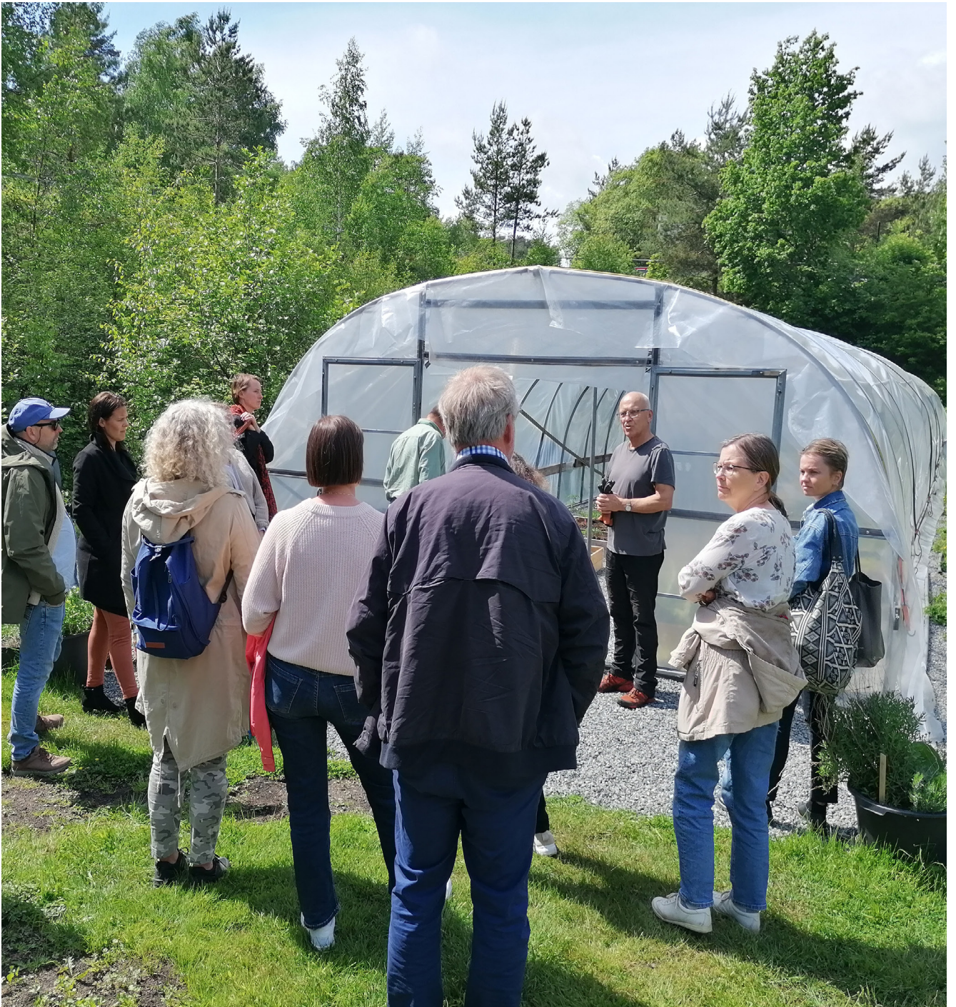
Kunnskapsformidling er en viktig del av virksomheten i Kristiansand andelslandbruk. Ikke bare til egne medlemmer, men også til interesserte besøkende som vil lære mer om både dyrking og hvordan dyrkingsfellesskapet er organisert.