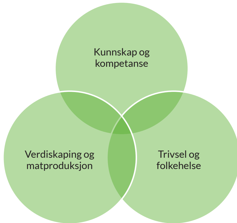
Figur 2: Målområder for urbant landbruk i Kristiansand kommune