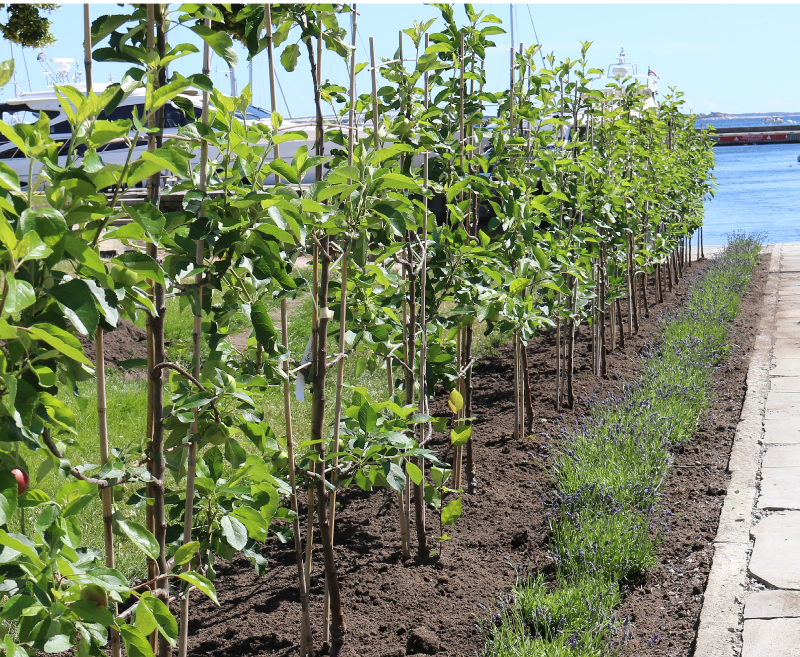
Epler i nytteveksthagen på strandpromenaden.